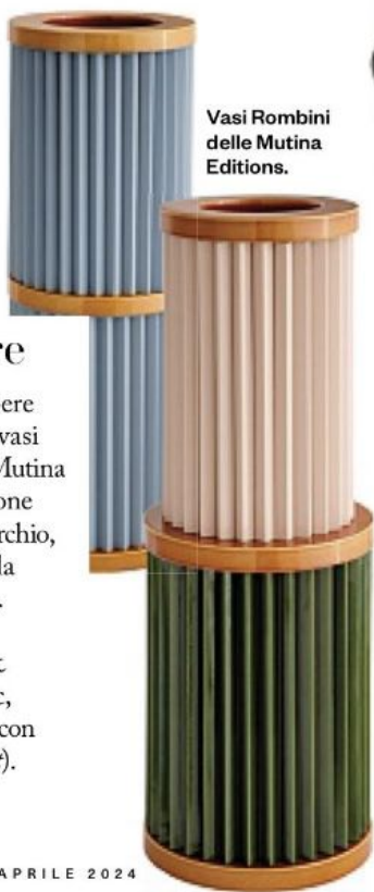
Vasi Rombini delle Mutina Editions.

Sono brillanti opere di artigianalità i vasi "Rombini" delle Mutina Editions: collezione dell'omonimo marchio, icona italiana nella materia ceramica. Un progetto dei designer Ronan & Erwan Bouroullec, in collaborazione con Bitossi ( mutina.it ).